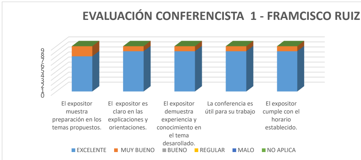
Gráfica No. 1 Calificación Total – FRANCISCO RUIZ

3.1.2 CONFERENCISTA 2: De los 9 encuestados efectivos, 9 calificaron al conferencista LEONARDO LEON en el Evento/capacitación, así: